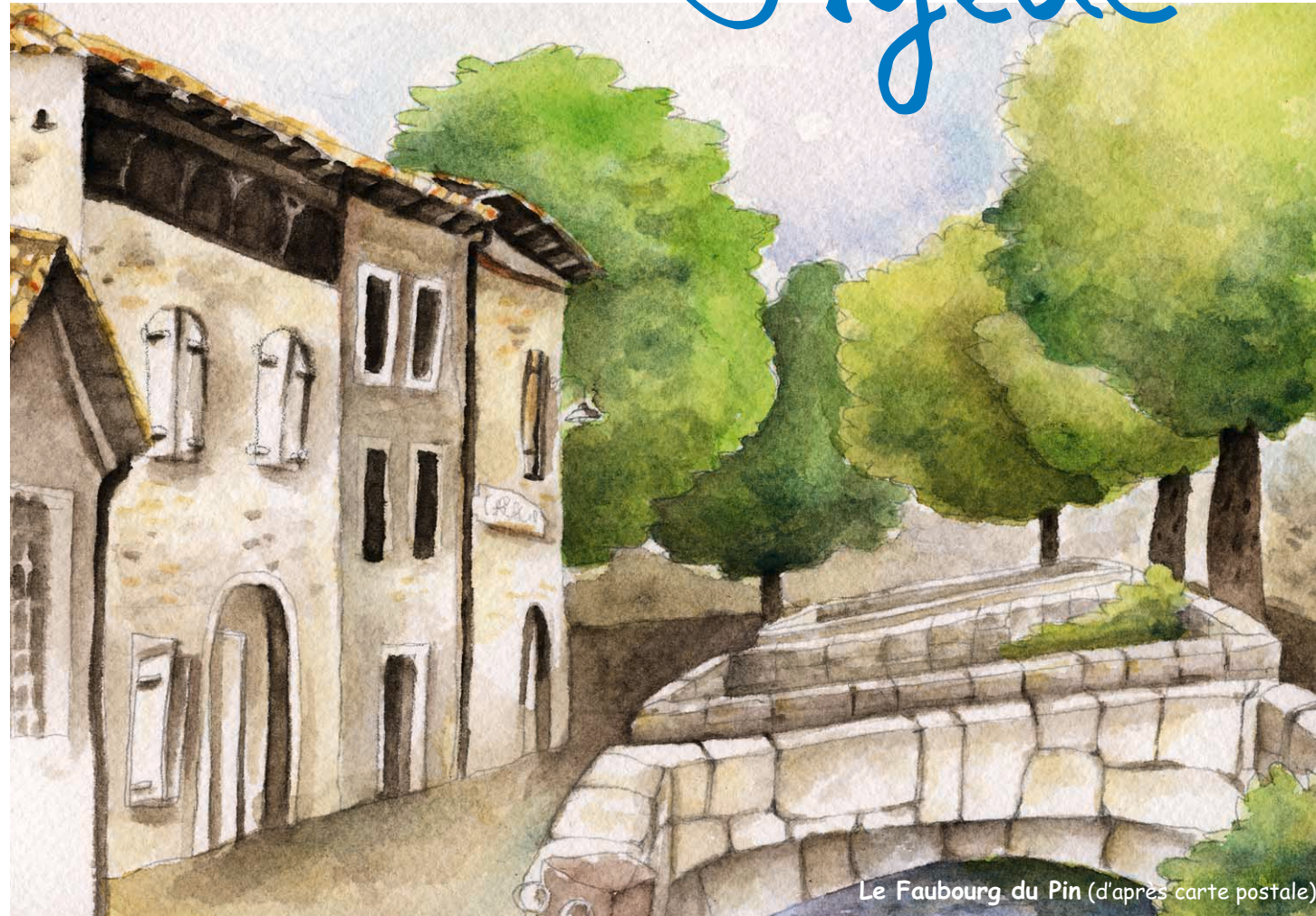
Le Faubourg du Pin (d'après carte postale)