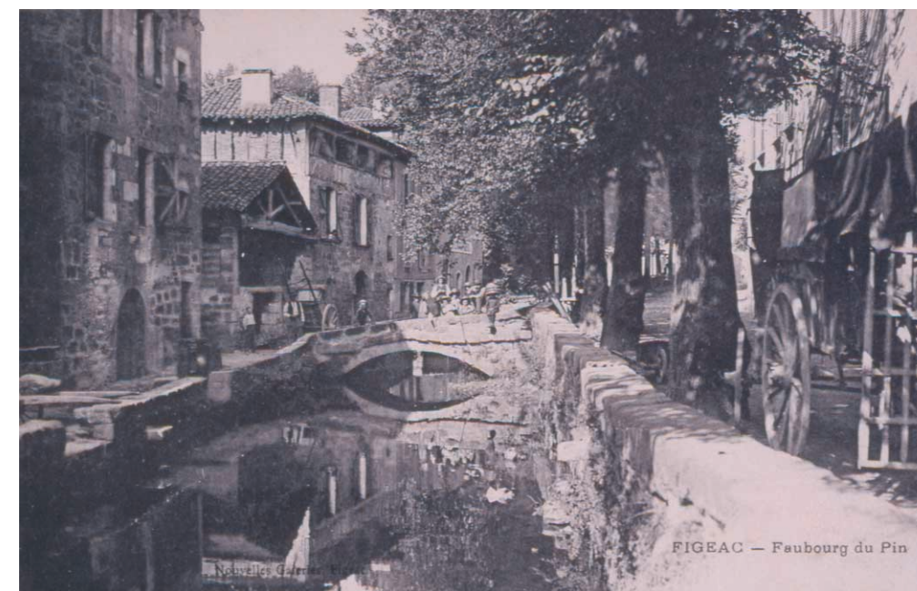
FIGEAC - Faubourg du Pin

Les vannes des moulins du monastère régulaient les quantités d'eau qui traversaient l'étang avant d'être rejetées dans le Célé. Il semble qu'il ait aussi existé quelques vannes le long du canal, au niveau de la rue du Faubourg du Pin pour permettre de décharger vers le Célé le trop plein d'eau en période de crues. Malgré ces aménagements, la retenue d'eau créa beaucoup de problèmes d'inondation.