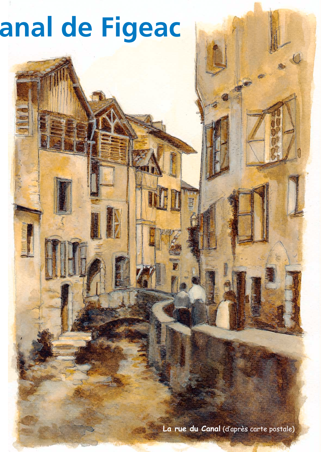
La rue du Canal (d'après carte postale)