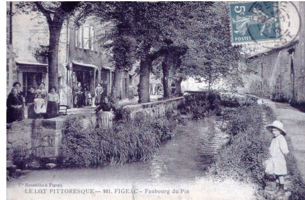
LE LOT PITTORESQUE - 981. FIGEAC - Faubourg du Pin

C'est au XIIIe siècle, durant les travaux menés par les moines de Saint-Sauveur, qu'un canal a été aménagé à l'entrée de Figeac. Les moines se servaient alors de l'eau pour faire flotter les bois nécessaires aux constructions, au chauffage et faire fonctionner les moulins banaux. Ces moines ont permis aux Figeacois de se servir du canal pour les mêmes usages, instaurant un impôt en contrepartie : ils prélevaient le douzième de la valeur des bois qui passaient sur le canal.